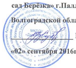
ГРАФИК РАБОТЫ КОНСУЛЬТАТИВНОГО ПУНКТА